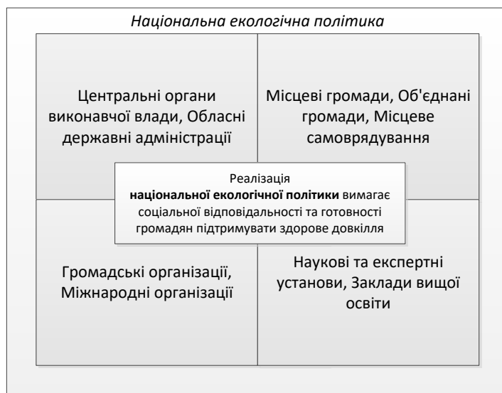
Рис. 2. Стейкхолдери національної екологічної політики

Хоча основна роль у формуванні та реалізації екологічної політики відведена державі, вона вже не є єдиним її суб'єктом. У цьому процесі беруть участь також політичні партії, наукові організації, органи місцевого самоврядування, неурядові громадські організації, інші інститути громадянського суспільства (суб'єкти), що перетворює екологічну політику на об'єкт публічного управління (рис. 2).