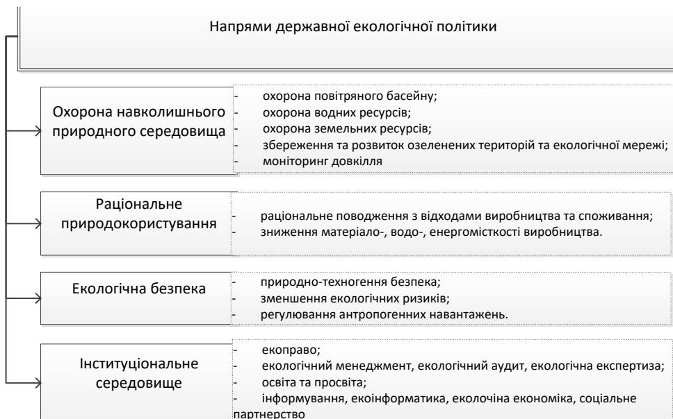
Рис. 1. Ключові напрями державної екологічної політики

Державна екологічна політика також визначається науковцями [1] як діяльність органів державної влади, що зорієнтована на формування та розвиток екологічного виробництва чи екологічного споживання та екологічної культури життєдіяльності людини (рис 1).