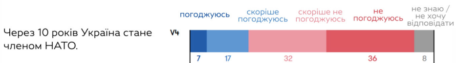
Рис. 2. Перспективи вступу України до НАТО. Бачення політичних груп країн Вишеградської групи [10]

Що стосується вступу України до НАТО, найбільш лояльно налаштовані до такого кроку польські респонденти: кожен третій з них погоджується або в певній мірі погоджується з можливістю того, що Україна стане членом НАТО протягом наступних 10 років. У чеській групі респондентів цей показник становить кожен четвертий, у словацькій – кожен п'ятий, а в угорській – ще менше (рис. 2) [10].