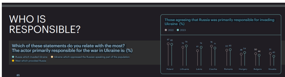
Рис. 3. Результати голосування у різних країнах щодо того, чи Росія несе головну відповідальність за вторгнення в Україну, % [11]

Згідно з тривалим опитуванням, проведеним на замовлення мозкового центру Globsec із Братислави, лише 40% опитаних вважають, що Росія відповідальна за війну в Україні, решта звинувачують Захід або саму Україну. Те ж саме опитування показало, що рівно половина опитаних словаків вважають, що США становлять загрозу безпеці їхньої країни, лише менше 54% вважали Росію прямою загрозою безпеці. Для порівняння: результати за 2023 рік показали, що суспільство Польщі на 85 % вважає Росію агресором та відповідальну за війну в Україні [11].